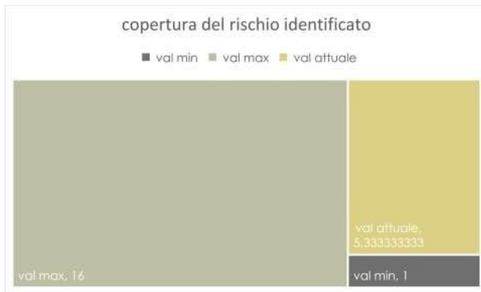
FIGURA 4 - COPERTURA DI RISCHIO

La copertura media del rischio all'attuale data viene riassunta dalla figura 2, che mostra sostanzialmente un'adeguata copertura del rischio possibile: